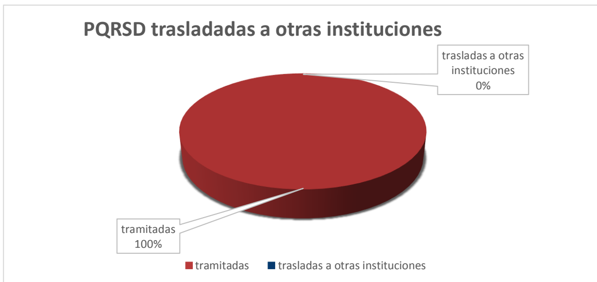
Grafica 02: PQRSD que fueron trasladadas a otras instituciones durante el primer semestre 2020

Durante el Primer Semestre del 2020 no se presentaron solicitudes para ser trasladadas a otras instituciones.