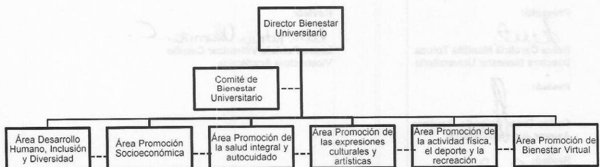
Ilustración 1: Estructura Organizacional Bienestar Universitario

Bienestar Universitario promoverá programas, proyectos y acciones orientados a la gestión del conocimiento, entendiendo que para la consecución de objetivos que generen bienestar en la comunidad académica se requiere del análisis, reflexión e investigación que posibiliten la construcción del conocimiento, intercambio y mejoramiento continuo, desarrollando capacidades y aprovechamiento de los recursos, herramientas TIC y competencias digitales que favorezcan el pensamiento crítico.