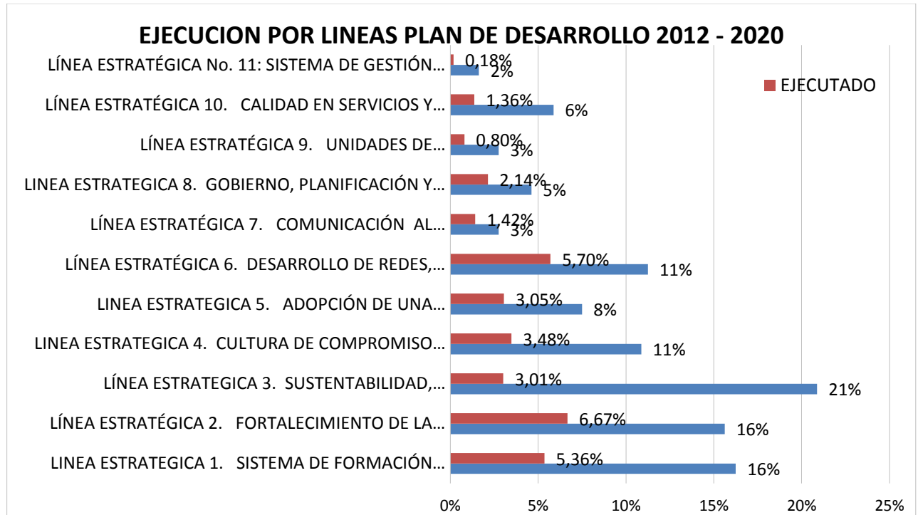
Grafica 1: Oficina de Planeación 2017

En la gráfica se puede observar el comparativo de los valores propuestos como metas (barras azules) y los resultados de la ejecución acumulada (barras rojas); transcurrido 4 años del Plan de Desarrollo 2012-2020, la ejecución del mismo, no alcanza al 505 que debería llevar, faltando para los 4 años restantes una ejecución del 66,83% como lo evidencia la gráfica siguiente: