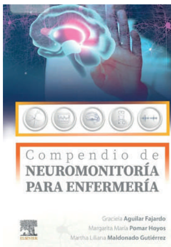
Portada del libro "Compendio de Neuromonitoría para Enfermería"