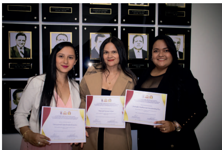
Docentes y estudiante de Terapia Ocupacional galardonadas por su semillero, fotografía Paula Rojas, pasante de la comunicación el Facultad.