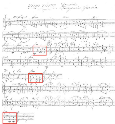
Figure 1. Ejemplo de Título de Figura

Note: Seguir estándar planteado en esta sección, también expuesta en la Guía para la Presentación de Artículos a la Revista de la Facultad de Artes y Humanidades de la Universidad de Pamplona .