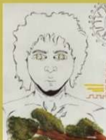
Perspicua Natura Say Henriquez Pérez @say.henriquez18 Serie de 2 fotografías y 2 ilustraciones 33 cm x 27 cm