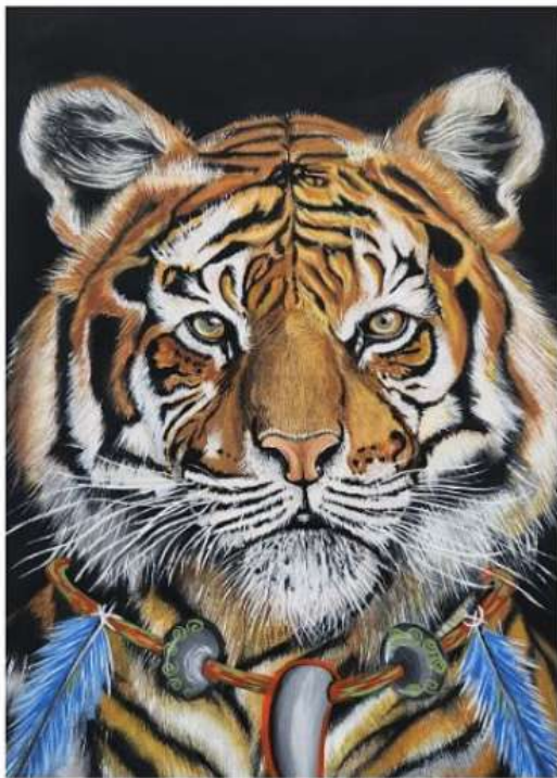
Libriachi Miguel Angel Jojoa Guancha @miguel_arte_maj Acrílico sobre lienzo 44 cm x 30 cm

Conciencia Salvaje es una obra que despliega un enfoque inspirador tejido con la esencia de un compromiso auténtico.