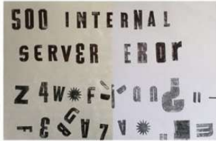
IMAGEN—// Nefh Valentina @nefhvalentina Imprenta de tipos 32 cm x 47 cm

<server error> <text> descompuesto </las miles de planas que hice en el colegio por no aprenderme las tablas de memoria/> <sobrecargar> <text> usar corrector en mis cuadernos para ocultar el error de una tinta roja/> <500> <breakdown> acostarme a las doce escribiendo los números del 0 al 500 en las líneas del ferrocarril/> <enmarcar> <text> ayer cometí un error, hoy cometí un error, mañana cometeré un error. Aún así, compré un marco de madera para colgarlo en la pared de mi casa, porque lo que no funciona también debería tener su mención de honor/>