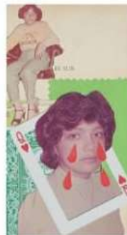
Al sur Alejandro Martínez @alejandroperez_ Collage 39cm x 28 cm

Madre, amor y magia. Estas son las palabras que si tuviera que elegir, describirían la obra de Alejandro. Son dos collages, imágenes cotidianas y recuerdos deconstruidos que se mezclan.