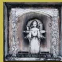
Les morjes Gina Paola Roa García @ginarg_20 Técnica Mixta 18 cm x 18 cm x 5 cm

Líneas, estilo particular y mirada femenina deconstruye la historia, denuncia la opresión, indaga el papel de la iglesia donde se utiliza la figura de la monja como imagen principal de la investigación creativa de la artista Gina Roa, chitarera, como es denominado a quien ha nacido en la zona de Chinacota, artista que logra transportarnos a través de su mirar crítico revelando formas desafiantes, desentrañando desde sus raíces y reflejado en sus actuales vivencias Pamplonesas.