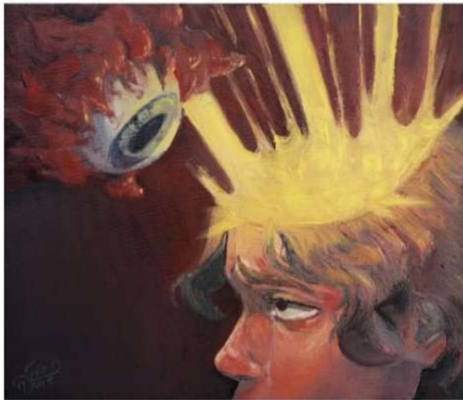
Tras el tercer ojo Esteban F. Villalba Ortiz @esvoart Oleo sobre lienzo 40 cm x 30 cm

“Si Dios esta adentro de nosotros, seremos tanto divinos y fuertes; como débil y suave.” Con esta frase abro vista a la obra del artista Esteban Villalba: Miedo a la introspección. Lienzo en oleo de 40 cm x 30 cm. Es una auto exploración casi mística, una mirada hacia sí mismo que puedo inferir podría estar incluso encima de lo que quien le pinta controla, casi como una entidad celestial juzgante.