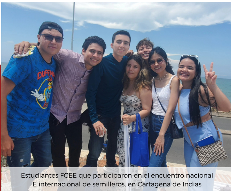
Estudiantes FCEE que participaron en el encuentro nacional E internacional de semilleros, en Cartagena de Indias