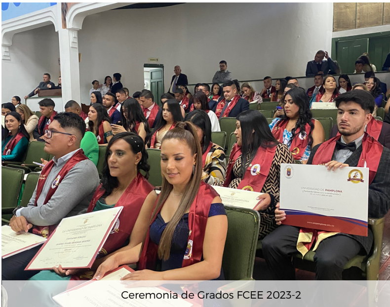
Ceremonia de Grados FCEE 2023-2