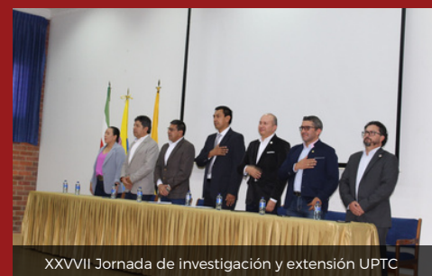
XXVII Jornada de investigación y extensión UPTC