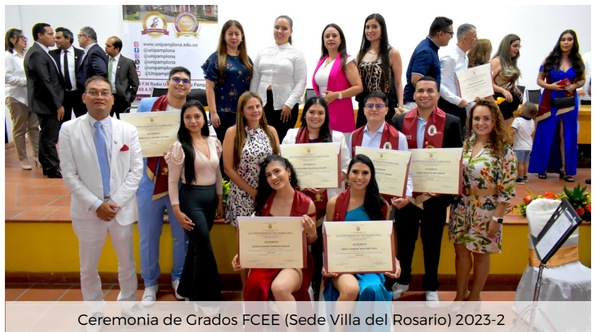
Ceremonia de Grados FCEE (Sede Villa del Rosario) 2023-2