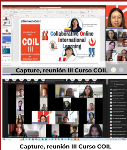
Capture, reunión III Curso COIL