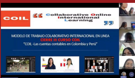
Captura de la reunión de cierre del Curso COIL