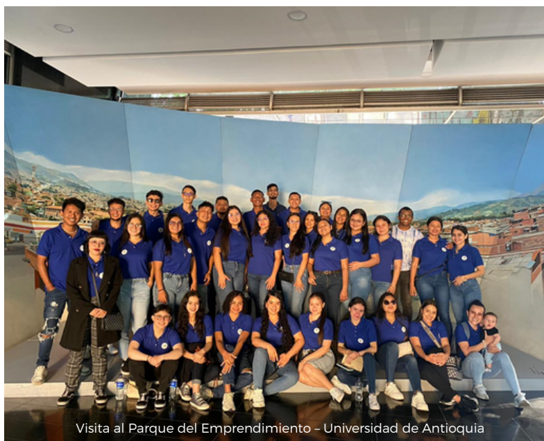
Visita al Parque del Emprendimiento - Universidad de Antioquia