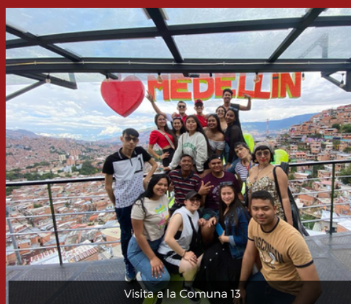
Visita a la Comuna 13

Las visitas fueron en: Parque del Emprendimiento - Universidad de Antioquia, Universidad EAFIT, C4TA - Ciudadela para la Carta Revolución Industrial y la Transformación del Aprendizaje, La Planta Cervecería, Parque Explora y la Comuna 13