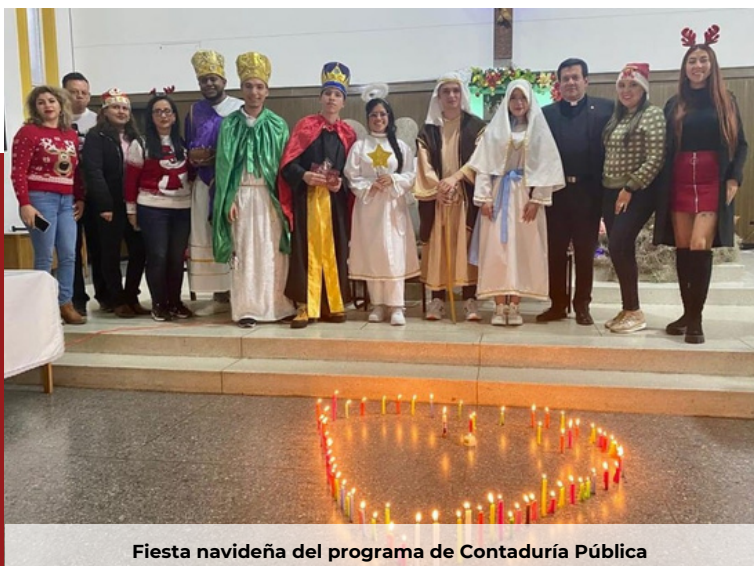
Fiesta navideña del programa de Contaduría Pública