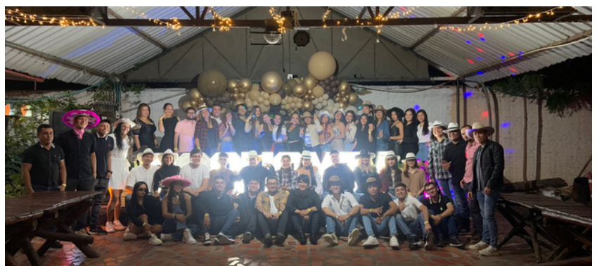
Estudiantes y docentes en la "Cena del Economista", sede Villa del Rosario