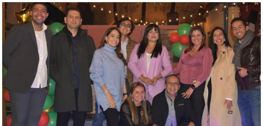
Docentes en la "Cena del Economista", sede Pamplona

En la sede de Villa del Rosario, la celebración tuvo lugar el 9 de diciembre, donde estudiantes y docentes se reunieron para disfrutar de una amena cena que cerró el ciclo académico de manera memorable. La participación activa de todos los asistentes demostró el espíritu de amistad que caracteriza al programa de Economía de nuestra Facultad.