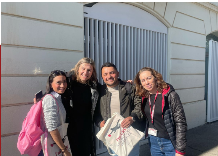
Acogida de nuestros estudiantes de Economía en España