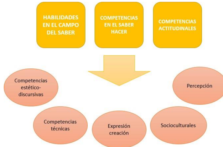
Figura no. 8. Competencias específicas para el programa de Artes Visuales.