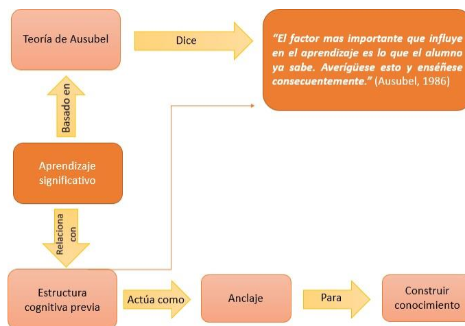
Figura no. 2. Teoría de Ausubel.

Ausubel (Citado por García Teske, 2003-2006) en torno a las Teorías del Aprendizaje Significativo, define el aprendizaje Significativo (Ver figura no. 2) como el proceso a través del cual las nuevas informaciones se relacionan con las estructuras del conocimiento del individuo, propiciando que la nueva información se inserte en los conceptos que ya existen en la estructura cognitiva del educando, generando una interacción entre los viejos y nuevos conocimientos y su consiguiente reorganización.