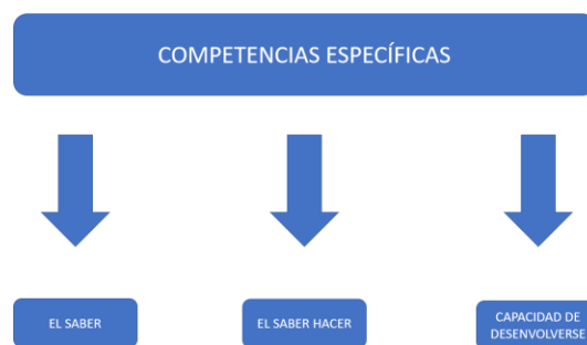
Figura no. 7. Competencias específicas.

A continuación, se describirán las competencias específicas para el programa de Artes Visuales (Ver figura no. 8), teniendo en cuenta la conjugación entre los conocimientos, habilidades, actitudes y valores que se espera despierte cada estudiante al finalizar su paso por este programa académico y, a la vez, las plantearemos a partir de las cinco competencias transversales que diseñó ACOFARTES (2011) para los distintos campos de las artes: