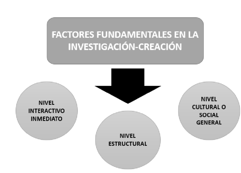
Figura no. 8. Factores fundamentales en la investigación-creación.

La investigación es entendida como desarrollo conceptual y solución de problemas que no tienen componentes fijos, la solución de problemas y reflexiones depende de la distribución de múltiples actividades de construcción, deconstrucción y re-construcción de aprendizajes significativos.