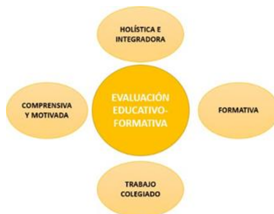
Figura No. 5. Evaluación educativo-formativa.