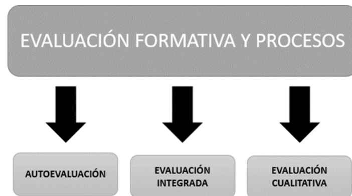
Figura No.6. Evaluación formativa y procesos.