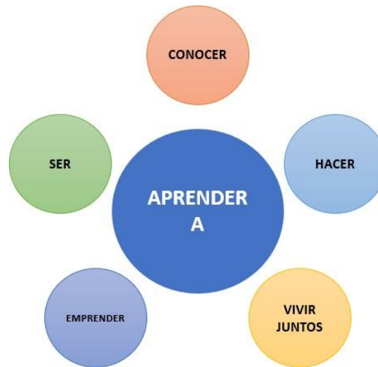
Figura no. 3. Aprendizajes.

Es necesario destacar, que la revisión de los anteriores enfoques pedagógicos para definir el del programa de Artes Visuales, tienen un énfasis marcado en nuestra identidad y realidad cultural regional, nacional y latinoamericana, lo que implica en sí mismo, un posicionamiento metodológico que aborda el arte, no como una manifestación divina o racional o meramente subjetiva, sino más bien como un punto de encuentro entre la razón, la subjetividad y la cultura.