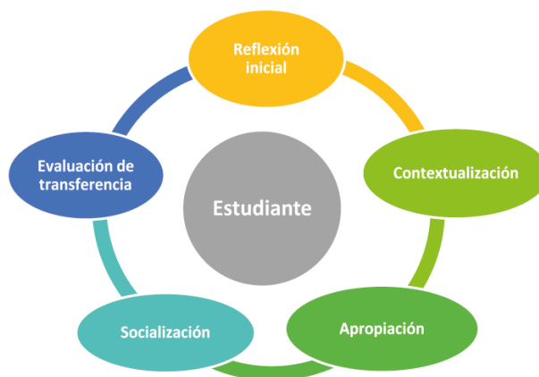
Figura no. 4. Modelo Formativo

“Una educación desde la cuna hasta la tumba, inconforme y reflexiva, que nos inspire un nuevo modo de pensar y nos incite a descubrir quiénes somos en una sociedad que se quiera más a sí misma. Que aproveche al máximo nuestra creatividad inagotable y conciba una ética y tal vez una estética para nuestro afán desahogado y legítimo de superación personal” (S.F. P. 9).