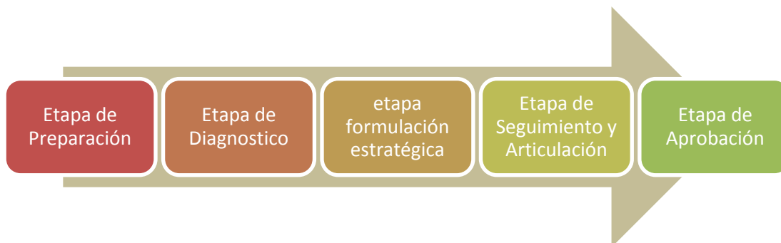
Figura 2. Etapas Plan de Desarrollo 2021-2030

Estas etapas son secuenciales y permite el análisis de cada uno de los productos resultantes, estos productos serán el insumo inicial para la construcción de la siguiente fase.