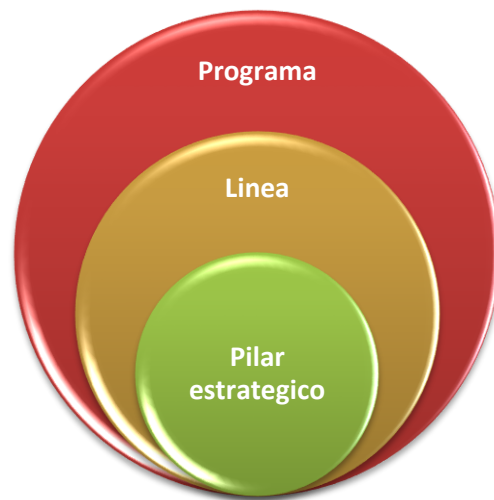
Figura 4. Estructura del Plan de Desarrollo

Estos son los mismos ejes evaluados en los talleres de la fase de diagnóstico, para este momento a los participantes se les socializarán los resultados obtenidos en la fase anterior. Para el desarrollo de este momento la metodología se desarrollará mediante mesas de trabajo, en las cuales realizaran propuestas de líneas estratégicas para el eje y a su vez programas para el desarrollo de estas.